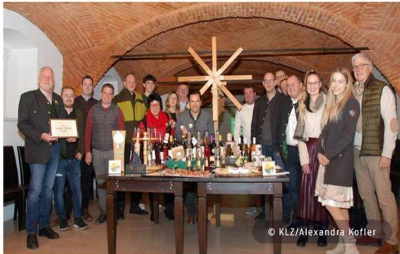
Die Projektverantwortlichen mit regionalen Partnerbetrieben

STEIERMARK LEBEN SPORT KLEINE ZEITUNG GRAZ & UMGEBUNG EINLOGG