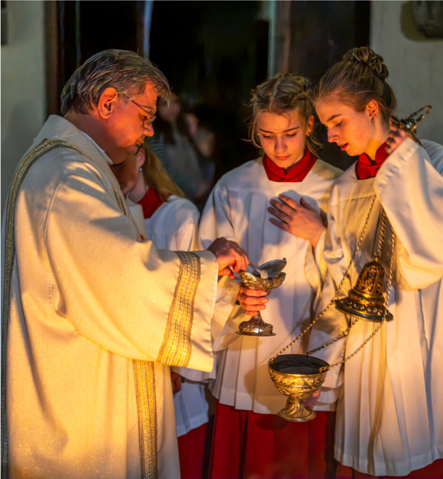
Von der Dunkelheit zum Licht: Osternacht auf dem Samerberg