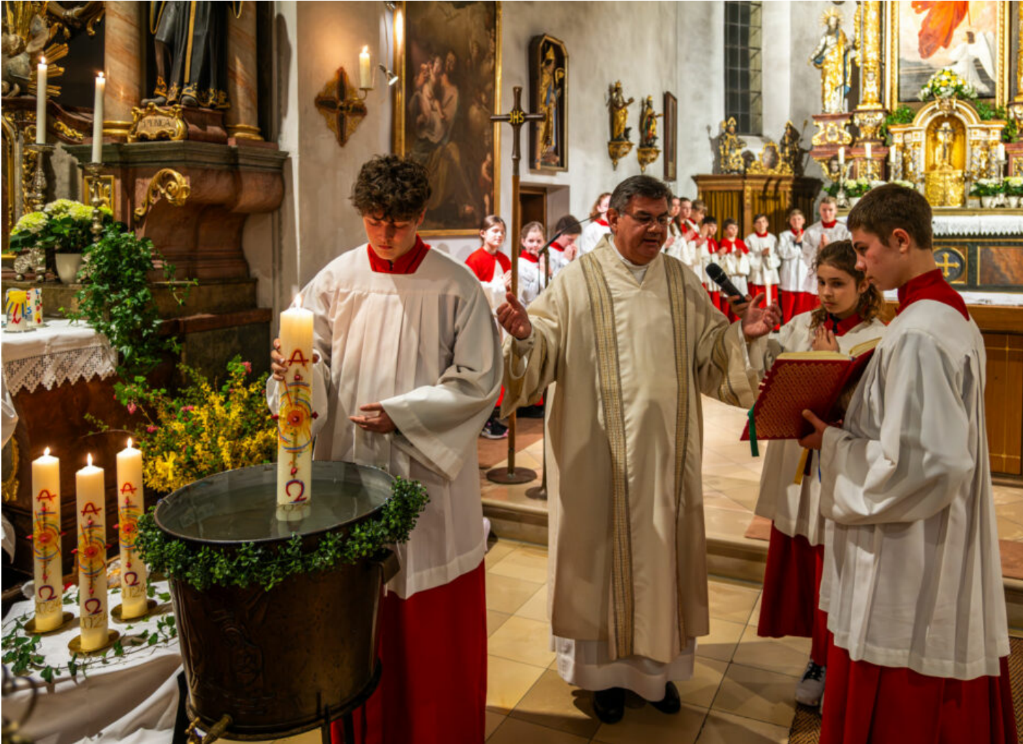
Von der Dunkelheit zum Licht: Osternacht auf dem Samerberg