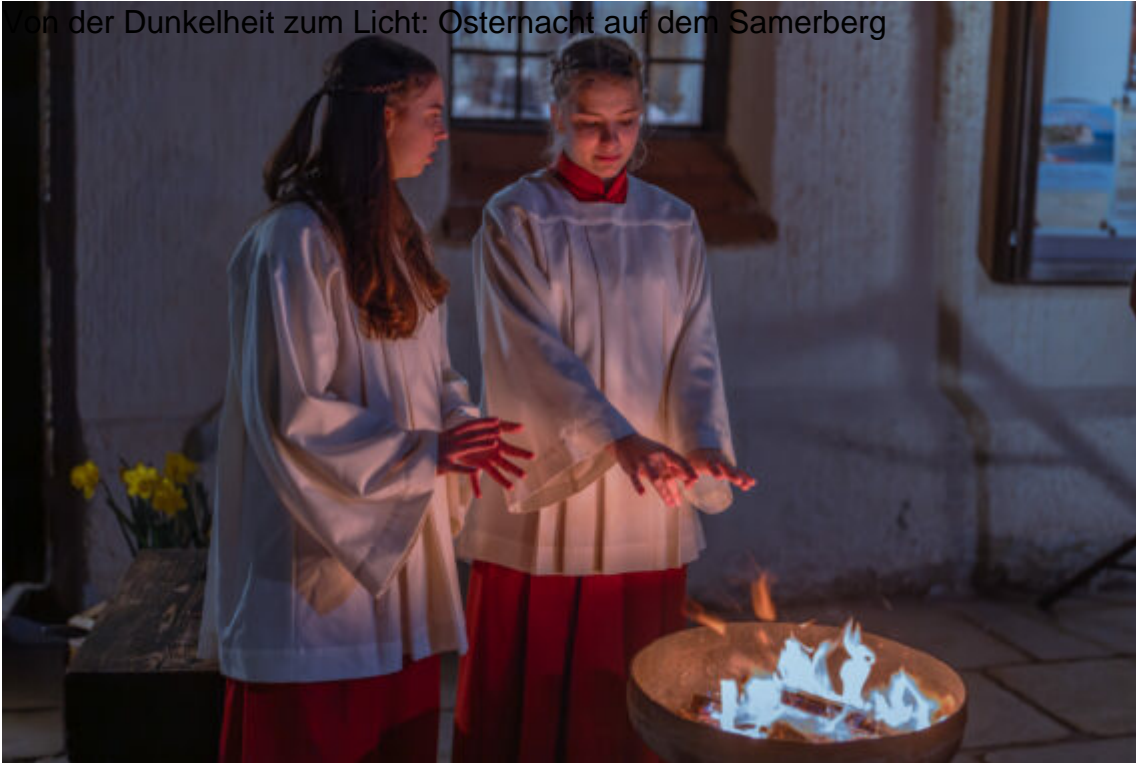
Von der Dunkelheit zum Licht: Osternacht auf dem Samerberg