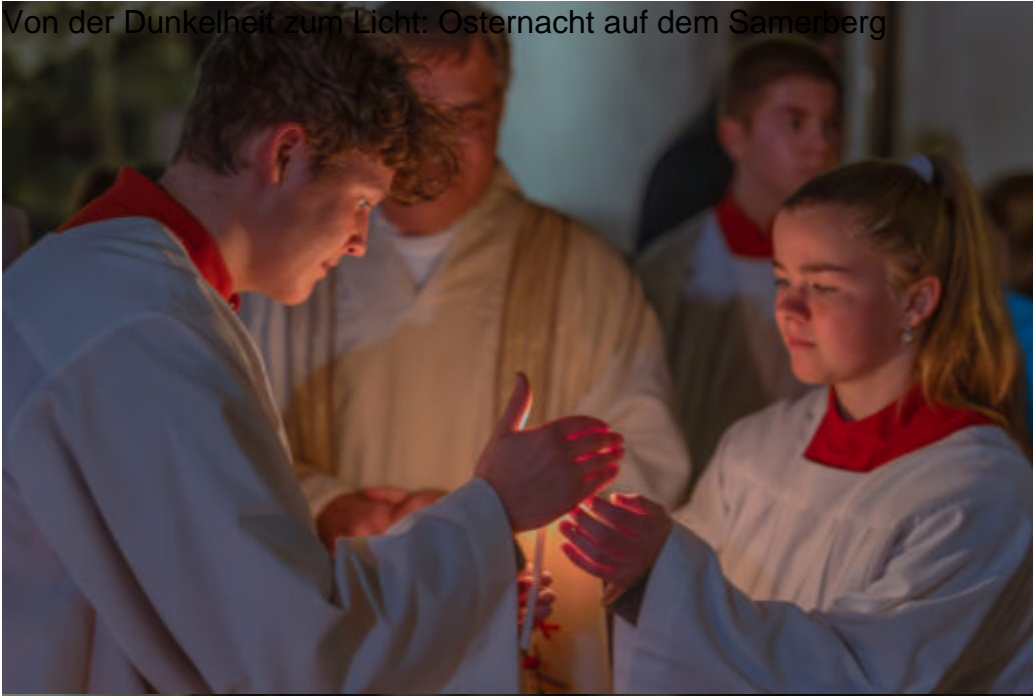
Von der Dunkelheit zum Licht: Osternacht auf dem Samerberg