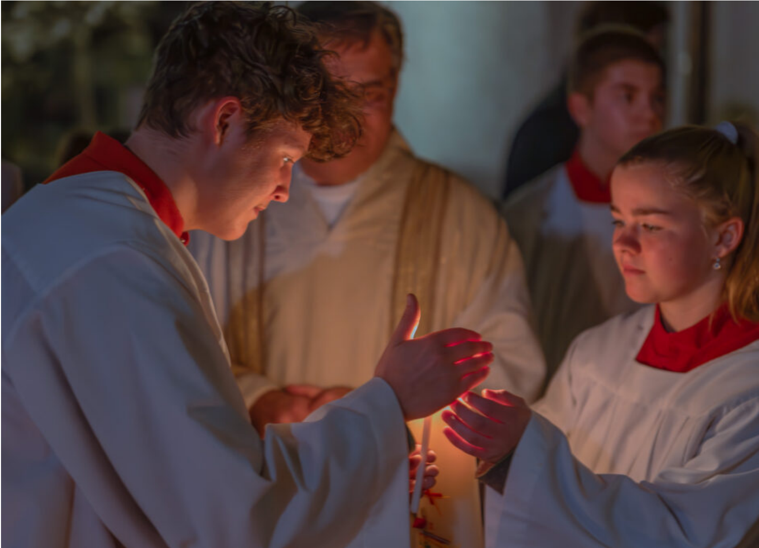
Von der Dunkelheit zum Licht: Osternacht auf dem Samerberg

In der Osternacht werden verschiedene Dinge gesegnet, darunter das Osterfeuer, die Osterkerze, das Taufwasser und die Speisen. Das Osterfeuer symbolisiert das Licht Christi, das die Dunkelheit erhellt und die Auferstehung Jesu feiert. Die Osterkerze wird entzündet, um die Anwesenheit Christi unter den Gläubigen zu symbolisieren. Das Taufwasser wird gesegnet, um die Erneuerung des Taufversprechens zu feiern. Die gesegneten Speisen, wie Brot, Eier und Fleisch, stehen für den Sieg des Lebens über den Tod und werden nach der Messe gemeinsam genossen. Die Segnung dieser Elemente in der Osternacht ist ein wichtiger Teil der liturgischen Feierlichkeiten und erinnert die Gläubigen an die zentrale Bedeutung von Ostern im christlichen Glauben.