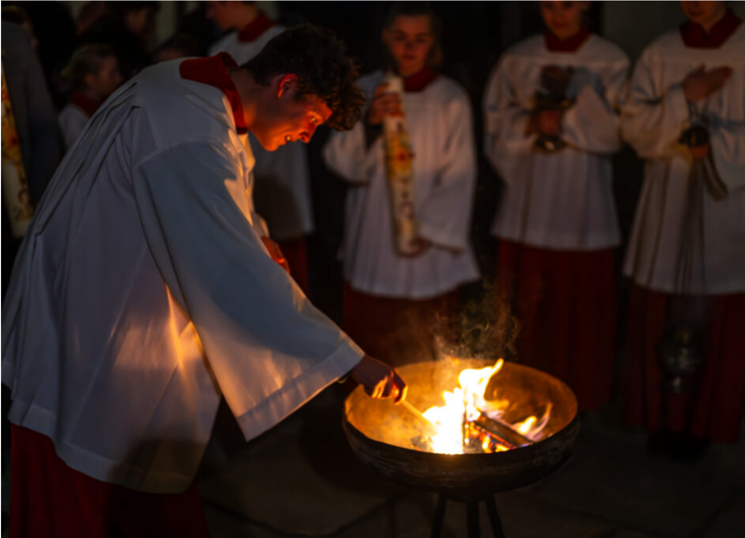
Von der Dunkelheit zum Licht: Osternacht auf dem Samerberg