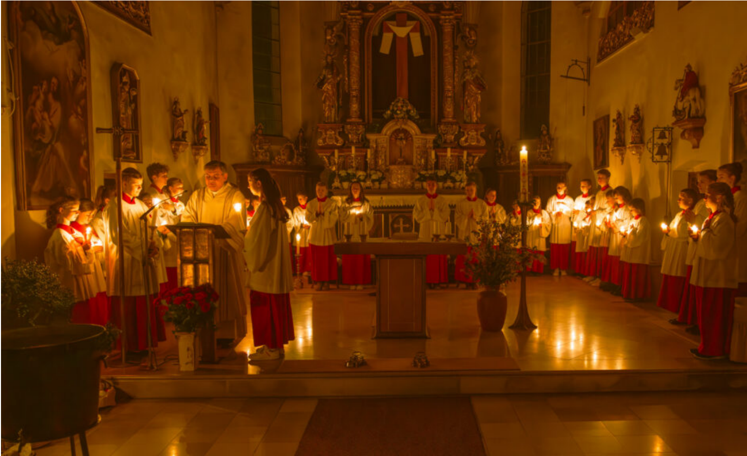
Von der Dunkelheit zum Licht: Osternacht auf dem Samerberg