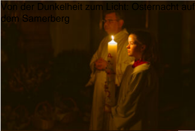
Von der Dunkelheit zum Licht: Osternacht auf dem Samerberg