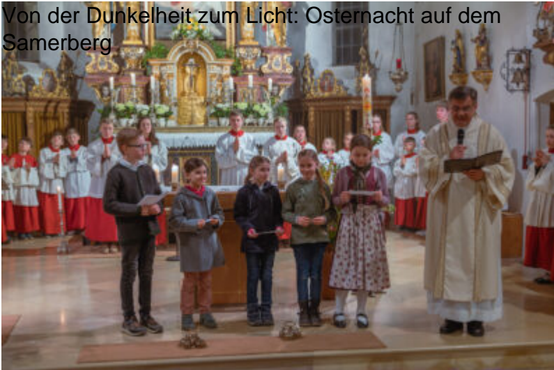
Von der Dunkelheit zum Licht: Osternacht auf dem Samerberg