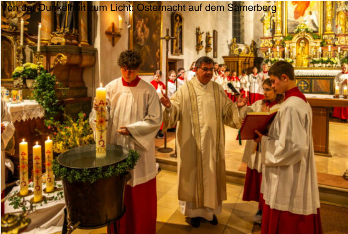
Von der Dunkelheit zum Licht: Osternacht auf dem Samerberg