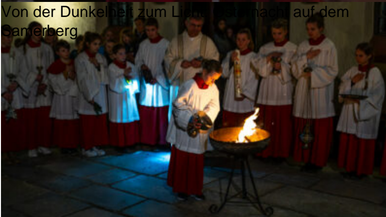
Von der Dunkelheit zum Licht: Osternacht auf dem Samerberg