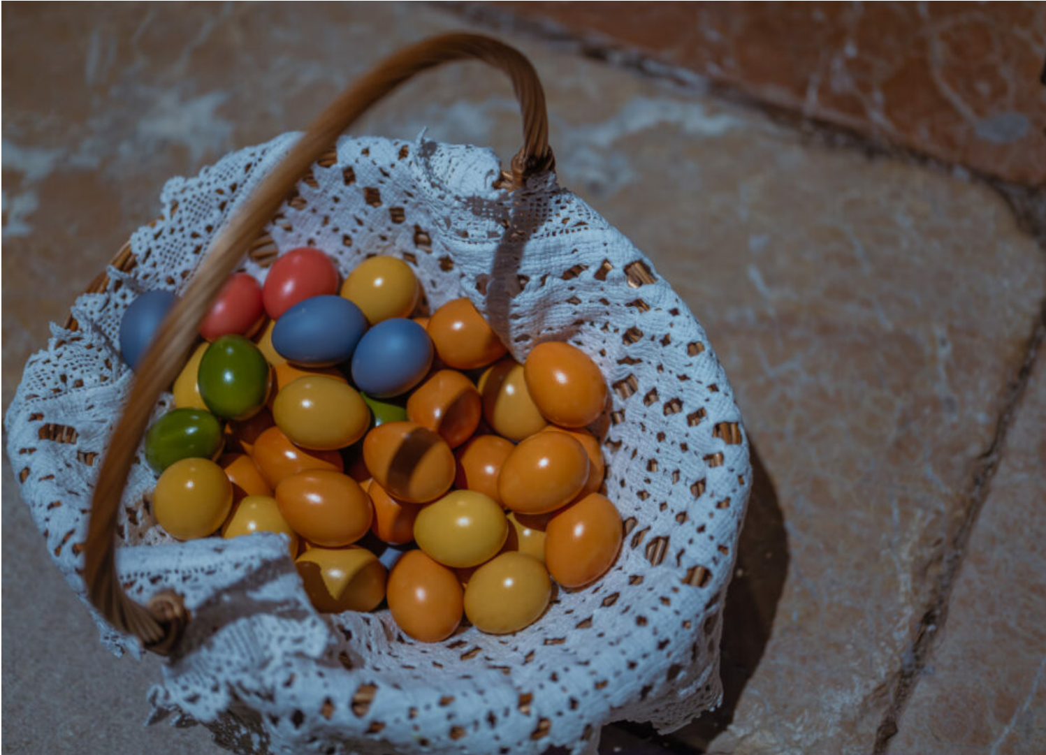
Von der Dunkelheit zum Licht: Osternacht auf dem Samerberg