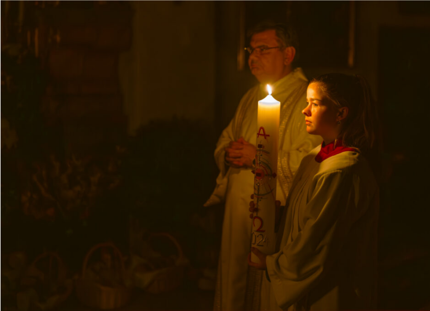
Von der Dunkelheit zum Licht: Osternacht auf dem Samerberg

Angeführt von der Osterkerze und begleitet von Gesängen wie dem Exsultet, zieht die Gemeinde in einer feierlichen Prozession in die dunkle Kirche ein. Die Gläubigen tragen Kerzen, die vom Licht der Osterkerze entzündet wurden.