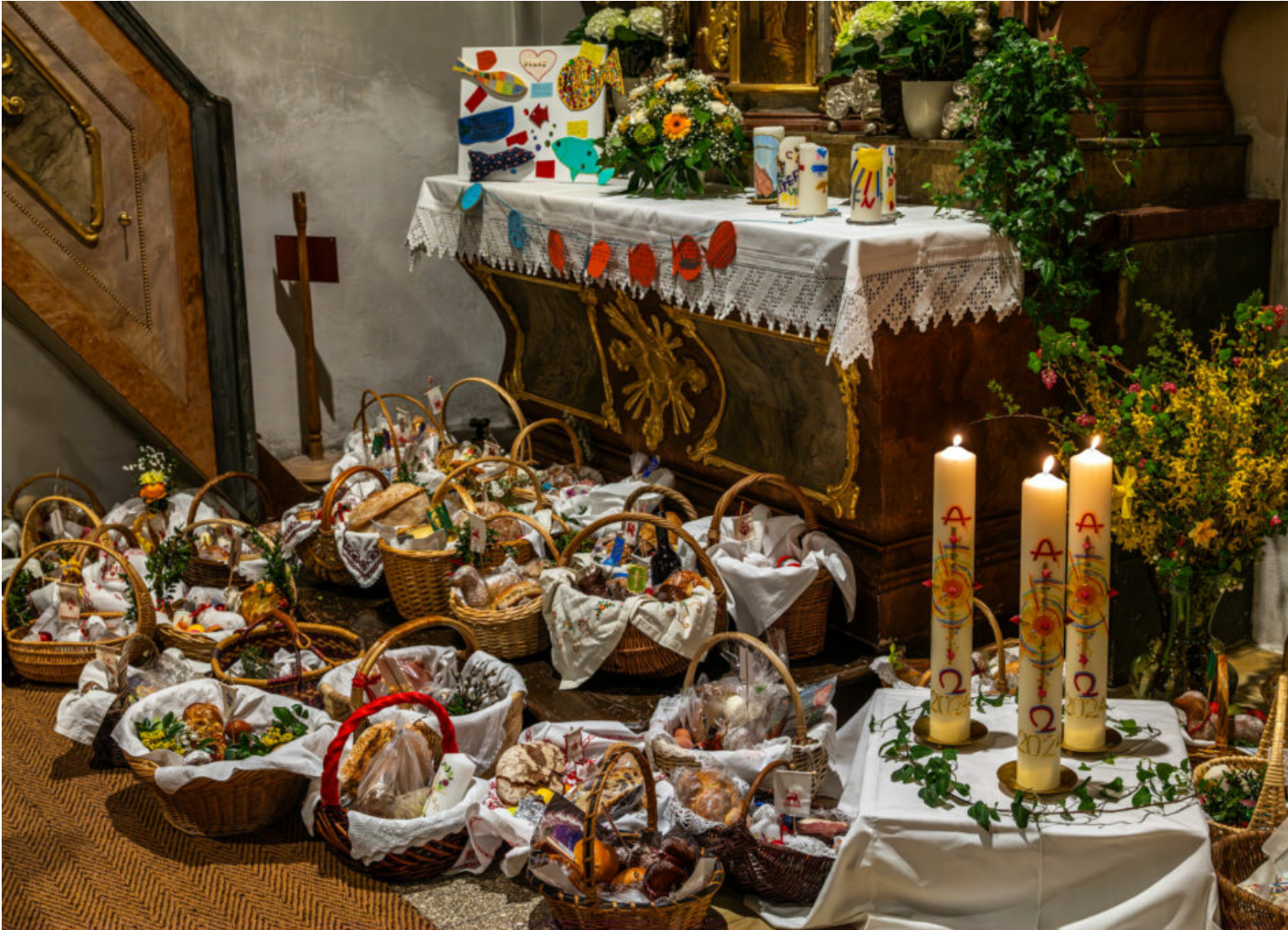
Von der Dunkelheit zum Licht: Osternacht auf dem Samerberg