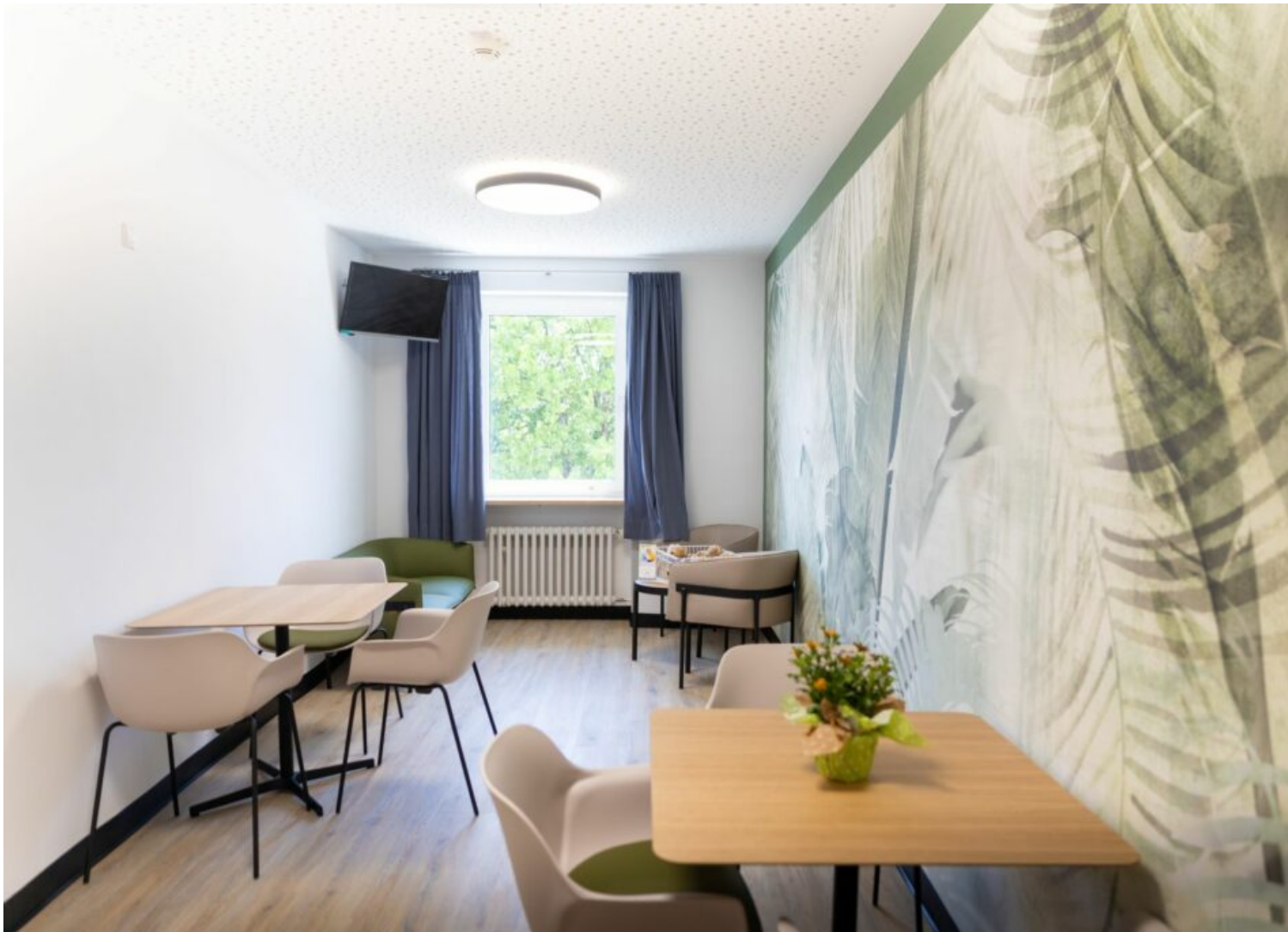
Aufenthaltsraum mit TV

Mehr Informationen zur Klinik für Kinder- und Jugendmedizin: Kinder- und Jugendmedizin mit Perinatalzentrum – RoMed Kliniken (romed-kliniken.de)