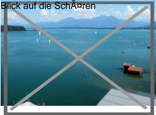
Blick auf die Schären