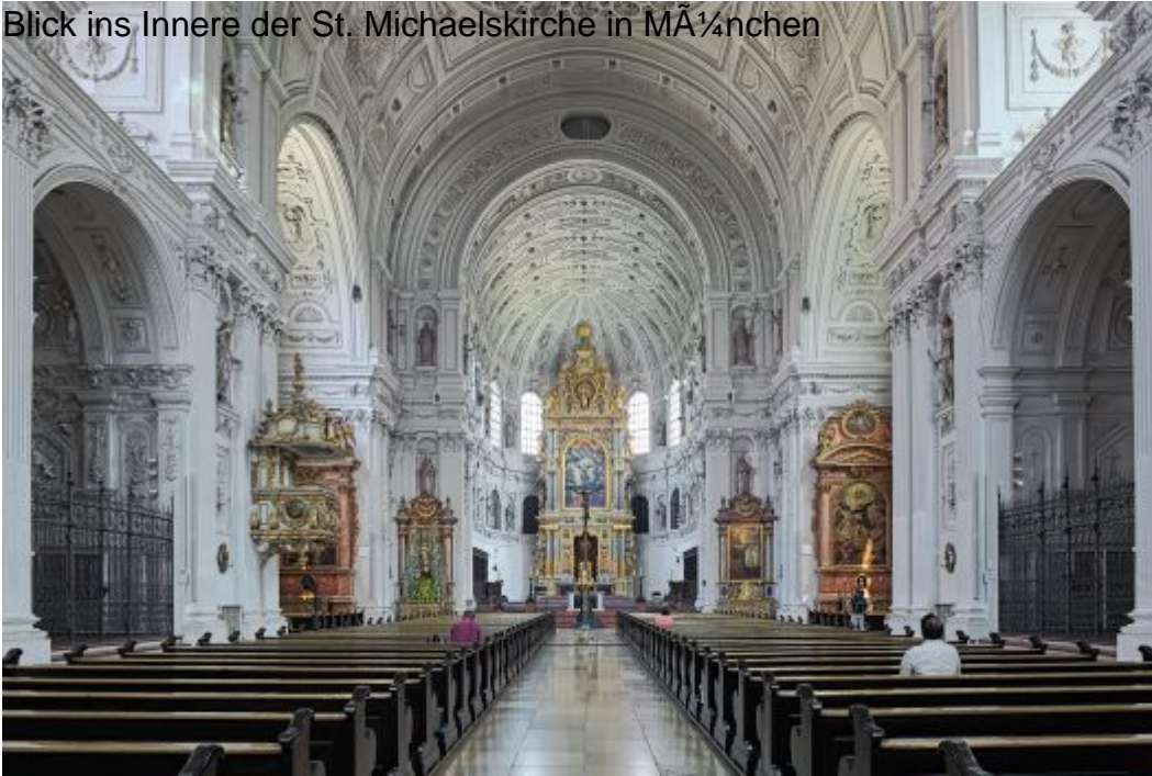
St. Michael ist eine Jesuitenkirche in M nchen. Es ist die gr  te Renaissance-Kirche n rdlich der Alpen.