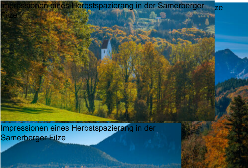
Impressionen eines Herbstspazierang in der Samerberger Filze