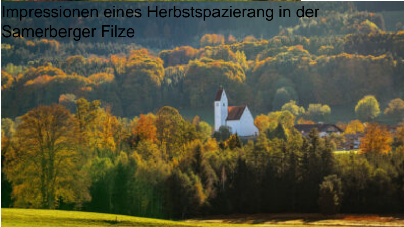
Impressionen eines Herbstspazierang in der Samerberger Filze