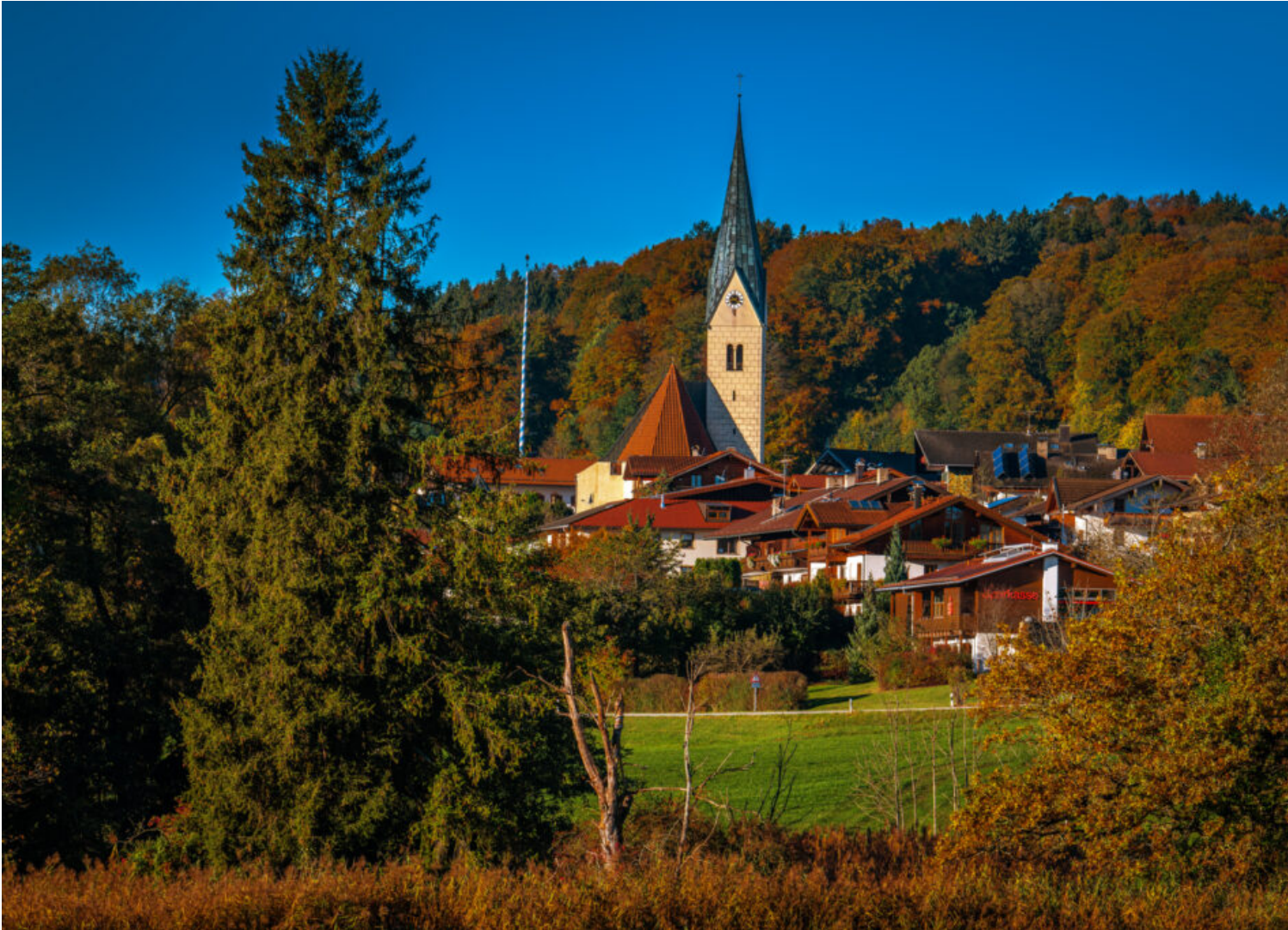
Impressionen eines Herbstspazierang in der Samerberger Filze

Dein Herbstspaziergang in der Samerberger Filze an diesem sonnigen Herbstmorgen ist eine Zeit der Kontemplation, des Staunens und der Verbindung zur Natur.