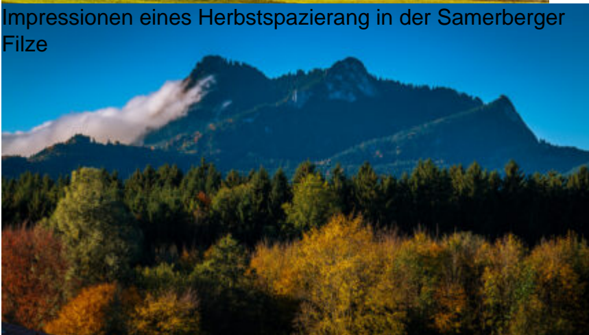
Impressionen eines Herbstspazierang in der Samerberger Filze