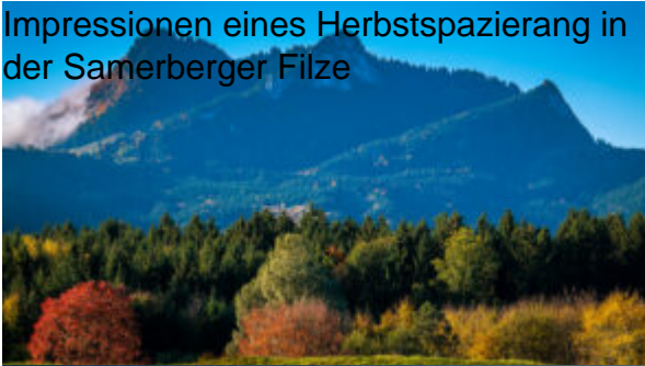
Impressionen eines Herbstspazierang in der Samerberger Filze