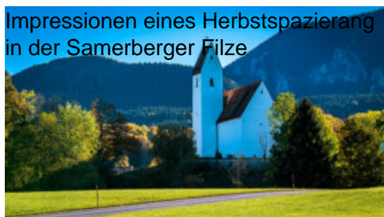
Impressionen eines Herbstspazierang in der Samerberger Filze