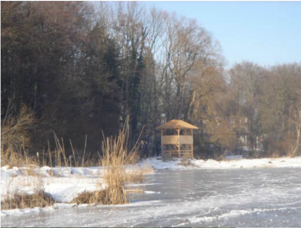
Turm am Ganszipfel idyllisch zwischen Auwald und Schilf