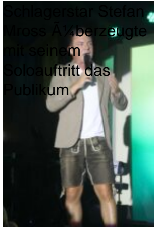
Schlagerstar Stefan Mross überzeigte mit seinem Soloauftritt das Publikum.