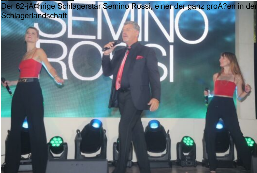
Der 62-jährige Schlagerstar Semino Rossi, einer der ganz Großen in der Schlagerlandschaft