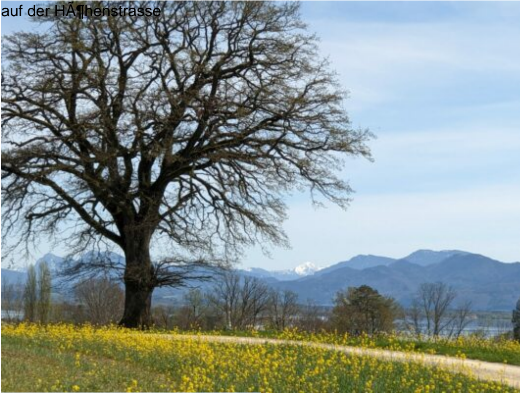
auf der HÄ¶henstrasse