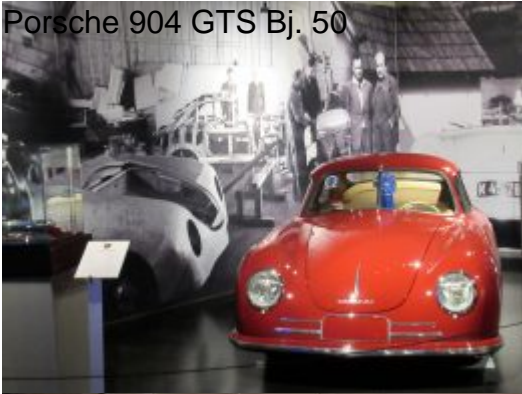
Porsche-Ausstellung eines der ersten Porsche Rennautos