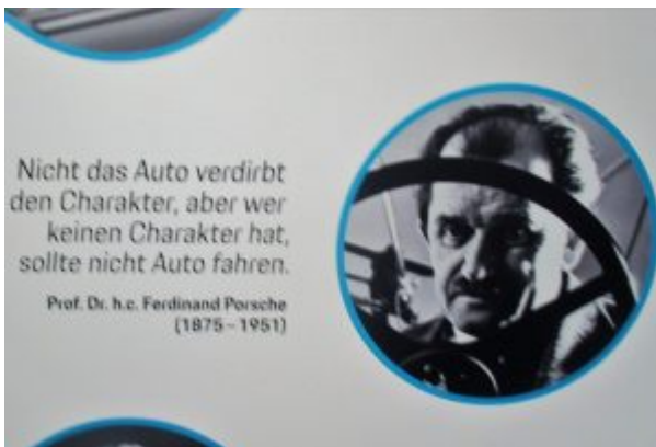
Ferdinand Porsche – Zitat

Hans Peter Porsche entdeckte Ende der 70er Jahre die Welt der Modelleisenbahnen und die Faszination für Blechspielzeug. Seine außergewöhnlichen gesammelten Schätze mit der Welt zu teilen, wurde im Traumwerk in Anger Wirklichkeit.