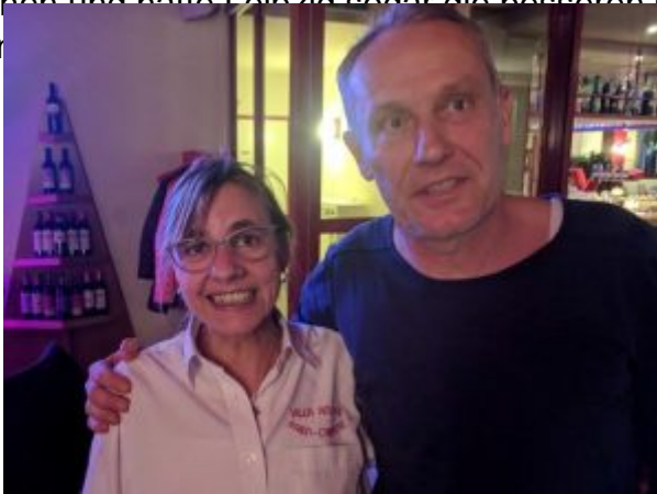
der Trainer mit der Villa am See – Chefin

Der sympathische Star-Trainer, bei der Wahl zum Trainer des Jahres schon einmal dritter hinter Jürgen Klopp und Lucien Favre, konnte in der wie immer angenehmen Atmosphäre ungestört Fußball schauen und war sich mit mir am Ende einig: das Ergebnis (0:0) ging in Ordnung – in der ersten Halbzeit waren zwar die Bayern etwas besser, aber in der zweiten Halbzeit war das Spiel ausgeglichen und hatte Leipzig sogar die besseren Chancen. Und von den Spielern hat ihm Kimmich am besten