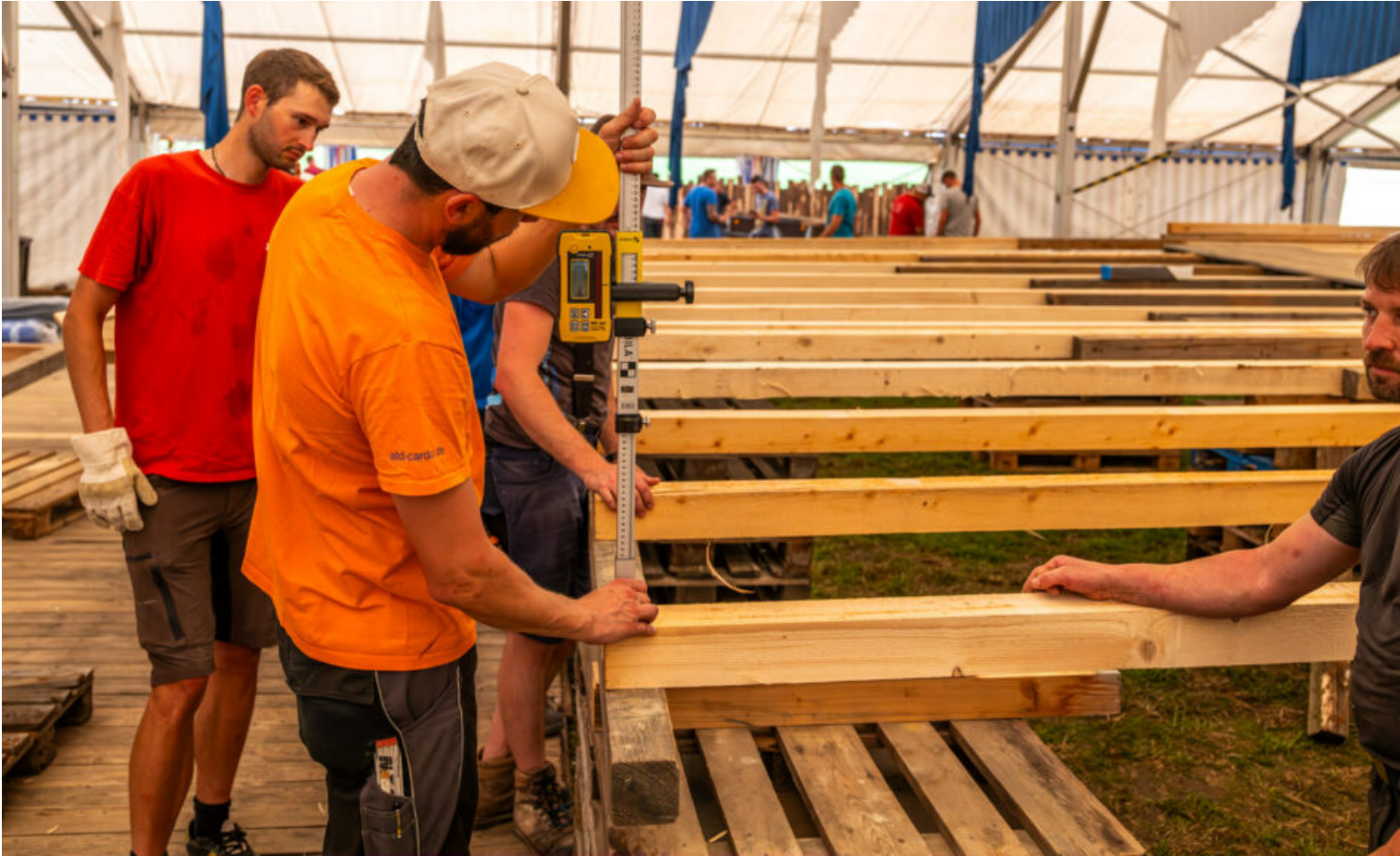
Bühnenaufbau mit den Mitgliedern des Trachtenverein Roßholzen