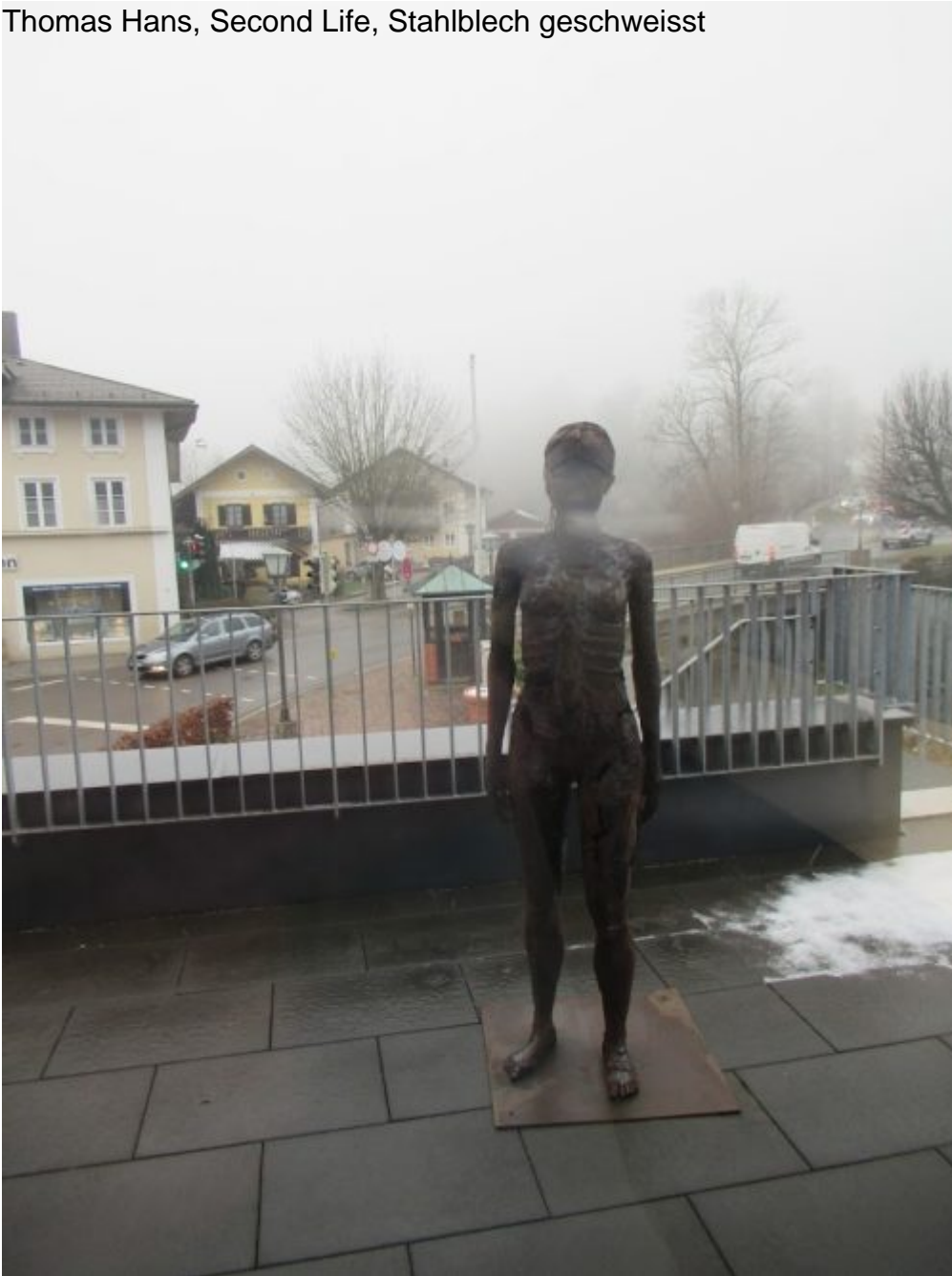
Thomas Hans, Second Life, Stahlblech geschweisst