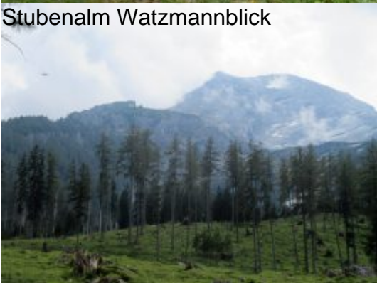
Untersbergblick von der Stubenalm