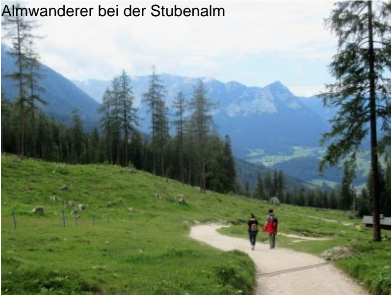
Almfahrer Äberholt Amwanderer